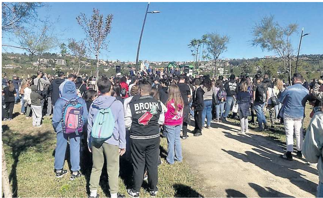
MEMORIA Il parco urbano di Quarto intitolato a Giancarlo Siani

Il percorso per l'intitolazione è stato partecipato e sentito: nei mesi scorsi il Comune ha lanciato un concorso di idee aperto a tutte le scuole della città, ricevendo oltre 2.400 proposte da studenti di ogni ordine e grado. La scelta di dedicare il parco a Giancarlo Siani è arrivata il 19 settembre scorso - giorno della sua nascita - ed è stata votata all'unanimità dalla giunta. «Coinvolgere gli studenti in questa decisione è stato un atto significativo - sottolinea il sindaco metropolitano Gaetano Manfredi - ed è bello che siano stati proprio i giovani del territorio a scegliere il nome. È un segnale importante, soprattutto per noi adulti: ci